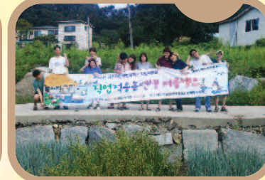
8월 30일~31일 이틀 간 직업적응훈련반에서는 "힐링...그리고 새로운 시작"이라는 주제로 여름캠프를 다녀왔습니다.