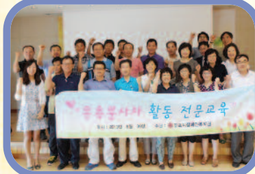
6월 30일 목욕봉사를 위한 목욕봉사자 활동 전문교육이 진행되었습니다.