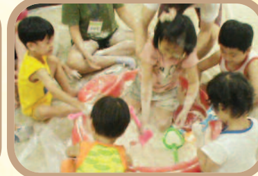
8월 6일~8월 3일간 감각수용기를 촉진하고 또래관계 개선을 위해 통합치료계절학교를 진행하였습니다.