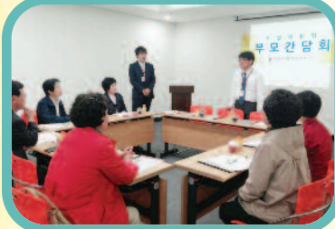
5월 10일 상반기 직업적응 훈련생 부모간담회를 실시하였습니다.