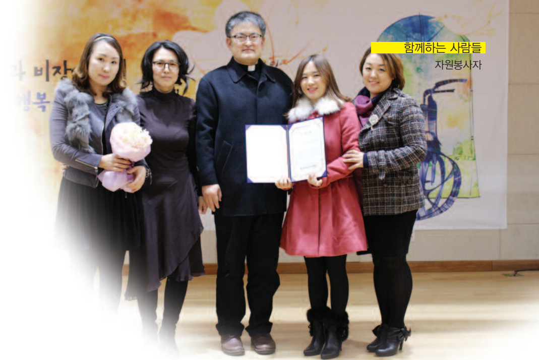
2013년 후원자·자원봉사자 송년의밤 행사에 자원봉사부문 감사장을 받는 모습(왼쪽에서 두 번째)