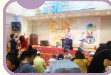
7월 20일 한국문화예술회관협회의 지원으로 '환상의 버블쇼와 모래가 들려주는 행복한 이야기' 공연을 가졌습니다.