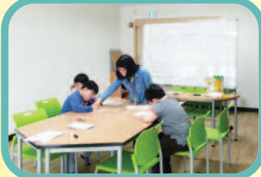
5월 1일 초등학교생의 다양한 신체활동, 체험활동 등을 통해 사회적응력을 키우는 해찬나래가 실시되었습니다.