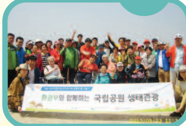
5월 23일 태안해안 국립공원으로 재가장애인분들과 함께 행복한 봄나들이를 떠났습니다.