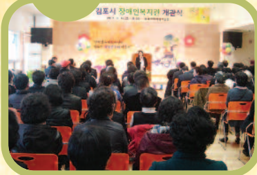
2013년 4월 12일 김포시장애인복지관이 개관식을 가졌습니다. 함께 해주신 모든 분들께 감사드립니다.