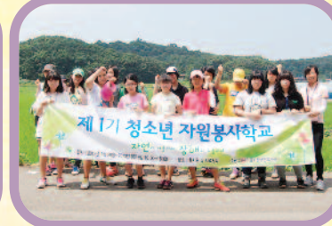
7월 29일~8월 9일 '자연과 어울리며, 장애와 소통하다'라는 주제로 제1기 청소년자원봉사학교를 진행하였습니다.