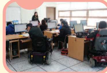
9월 2일 하반기 장애인정보화교육을 개강하였습니다.