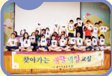
6월 7일 고촌초등학교에서 휠체어 체험, 시각체험 등 장애인식개선교육을 진행하였습니다.