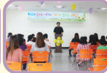
7월 29일~8월 9일 각종 체험활동, 현장학습 등 다양한 프로그램으로 구성된 늘해랑 여름학교를 진행하였습니다.