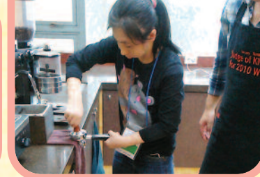
9월 2일~24일까지 직업적응훈련을 위한 바리스타교육을 실시하였습니다.