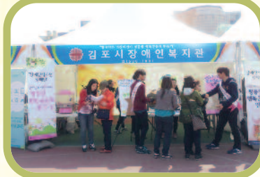
4월 27일 김포시민의날을 맞아 장애인식개선캠페인을 진행하였습니다.