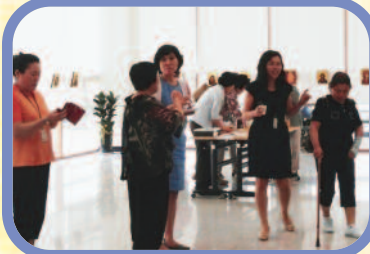
6월 24일~7월 12일 장애인과 주민들을 위한 문화행사로 이콘 전시회를 개최하였습니다.