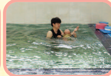
9월 13일 근력완화, 통증완화에 효과가 있는 수치료를 시작하였습니다.