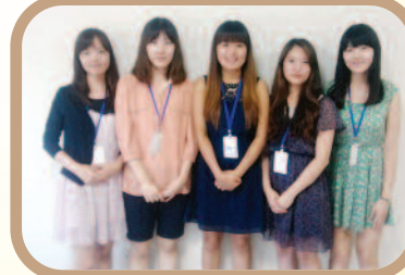
7월 22일부터 4주간 예비 사회복지사 5명과 함께 사회복지 실습을 진행하였습니다.